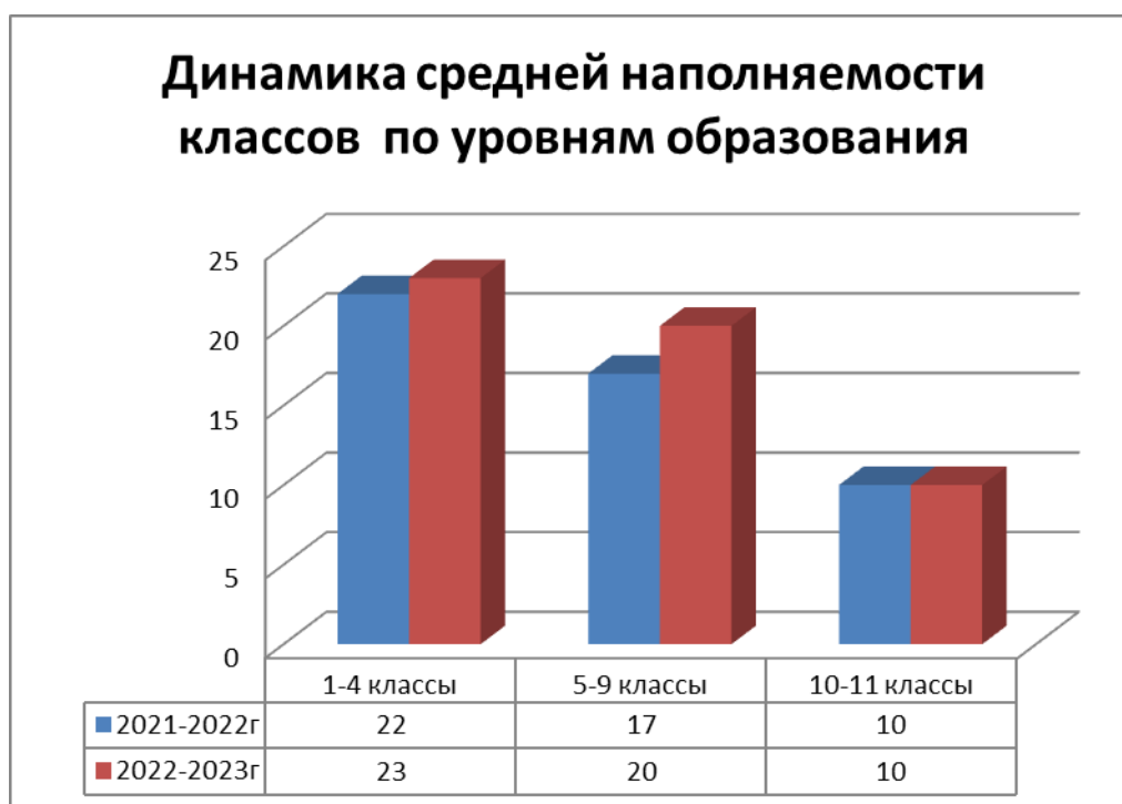
Диаграмма показывает, что в 2022/2023 учебном году средняя наполняемость классов повысилась по двум уровням образования.

Диаграмма показывает, что контингент школы в 2022/2023 учебном году уменьшился на 7 обучающихся.